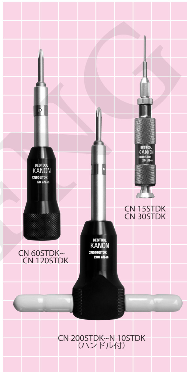
CN 15STDK CN 30STDK